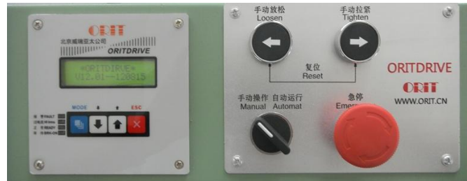
数字设定卷取张力